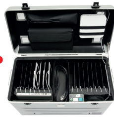
DaZ-Koffer mit iPads und Zubehör